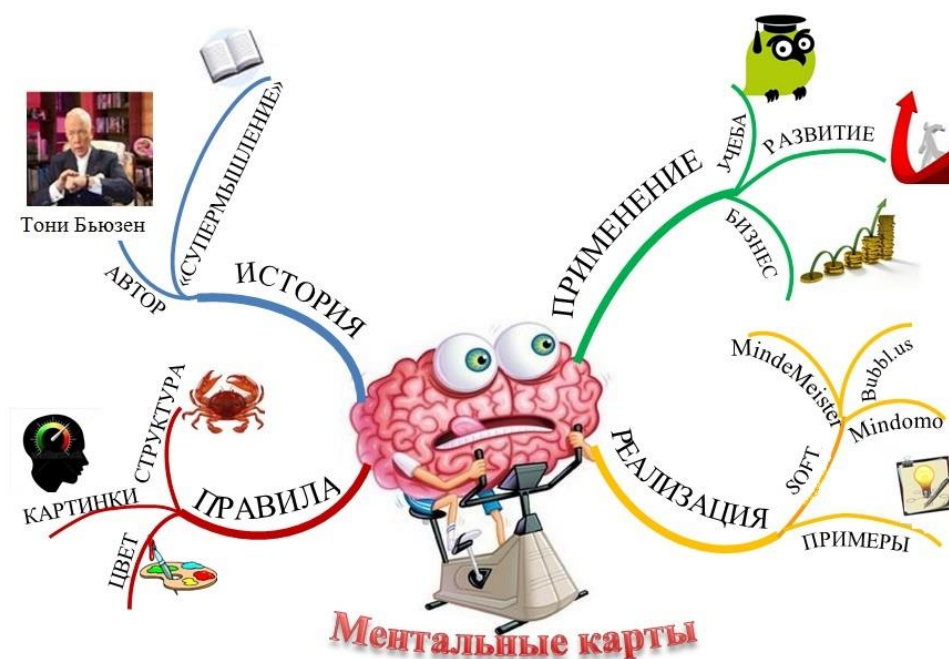
Рисунок 2: Ментальная карта рисовальный вариант